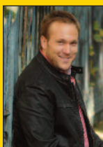
- MÁTÉ PÉTER EMLÉKKONCERT '70